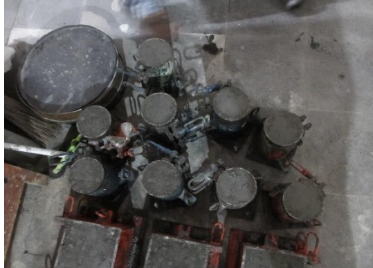
Gambar 2. Benda Uji silinder 100x200mm

dilakukan pada beton umur 1 dan 28 hari. Jumlah sampel yang digunakan pada penelitian ini sebanyak 12 buah. Metodologi adalah teori menghasilkan pengetahuan melalui penelitian yang akan Anda gunakan. Ini memberikan alasan untuk ke arah Anda melanjutkan peneliti.