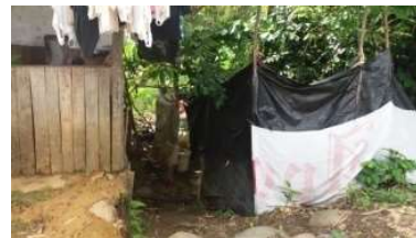
Kawasan Teluk Kabung Tengah