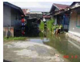
Kawasan Purus saat Banjir dan Genangan