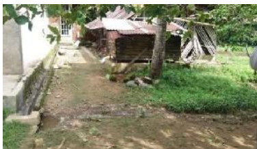
Kawasan Koto Tanggah Ikur Koto