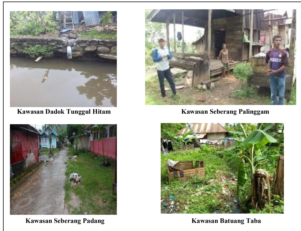
Gambar 4: Contoh kawasan kumuh kategori ringan