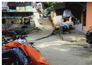
Kawasan Batang Arau