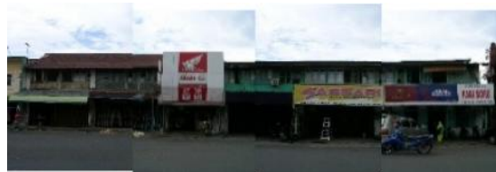
Gambar 5. Kondisi Bangunan Sebelum Tahun 2009

Gambar diatas merupakan gambaran kondisi deretan bangunan rumah makan pagi sore sebelum tahun 2009. Bangunan masih terlihat masih asli yaitu memperlihatkan ciri khas arsitektur etnis cina yang dapat dilihat dari bentuk atap dan bentuk bangunan. Secara bentuk arsitektural deretan bangunan ini belum ada mengalami perubahan bentuk. Namun di beberapa bangunan terdapat penambahan papan nama toko di bagian fasade bangunan yang berguna untuk memberikan identitas pada bangunan tersebut.