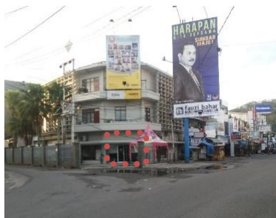
Gambar 4. Kondisi Eksisting setelah tahun 2009

Gambar diatas merupakan kondisi bangunan sebelum gempa 30 September 2009. Pada gambar dapat dilihat bahwa bangunan merupakan sebuah bangunan tunggal dengan jumlah lantai 3 lantai. Memiliki bentuk atap datar. Pada bagian kiri dan kanan terdapat sun shading yang menerus dari lantai dua hingga garis bawah atap, sedangkan pada bagian depan sun shading hanya terdapat di bagian atas. Pada lantai dasar terdapat rolling door yang berfungsi sebagai pintu utama masuk ke bangunan sedangkan jendela terdapat pada dinding kiri dan kanan berupa jendela kaca mati. Pada lantai satu dan dua terdapat satu pintu yang berguna untuk keluar bangunan menuju balkon, masing - masingnya memiliki jendela kaca nako dengan ukuran yang berbeda untuk masing-masing lantainya. Pada site bangunan terlihat menyatu dengan jalan karena tidak ada pembatas seperti pagar.