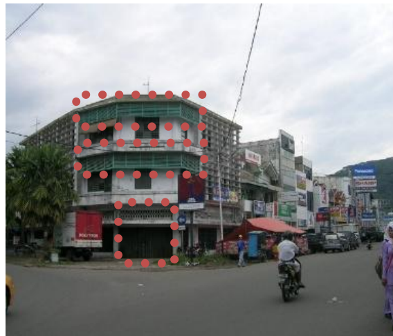
Gambar 3. Kondisi Eksisting sebelum tahun 2009

Gambar diatas merupakan kondisi bangunan sebelum gempa 30 September 2009. Pada gambar dapat dilihat bahwa bangunan merupakan sebuah bangunan tunggal dengan jumlah lantai 3 lantai. Memiliki bentuk atap datar. Pada bagian kiri dan kanan terdapat sun shading yang menerus dari lantai dua hingga garis bawah atap, sedangkan pada bagian depan sun shading hanya terdapat di bagian atas. Pada lantai dasar terdapat rolling door yang berfungsi sebagai pintu utama masuk ke bangunan sedangkan jendela terdapat pada dinding kiri dan kanan berupa jendela kaca mati. Pada lantai satu dan dua terdapat satu pintu yang berguna untuk keluar bangunan menuju balkon, masing - masingnya memiliki jendela kaca nako dengan ukuran yang berbeda untuk masing-masing lantainya. Pada site bangunan terlihat menyatu dengan jalan karena tidak ada pembatas seperti pagar.