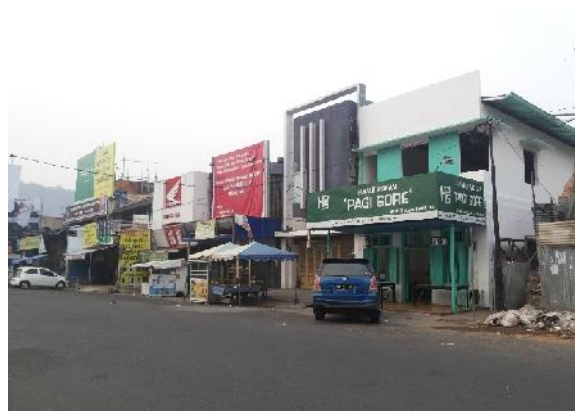
Gambar 6. Kondisi Bangunan Setelah Tahun 2009

Gambar berikut adalah gambaran kondisi deretan bangunan Rumah Pagi Sore setelah tahun 2009. Secara keseluruhan fasade bangunan ini telah mengalami banyak perubahan. Masing - masing bangunan memberikan identitas masing - masing, sehingga bangunan ini tidak terlihat lagi seperti bangunan deret yang utuh. Bangunan yang dulunya terlihat sama baik dari segi gaya arsitektural, warna, bentuk atap, letak, model, dan material pintu dan jendela sekarang sudah tidak terlihat lagi.